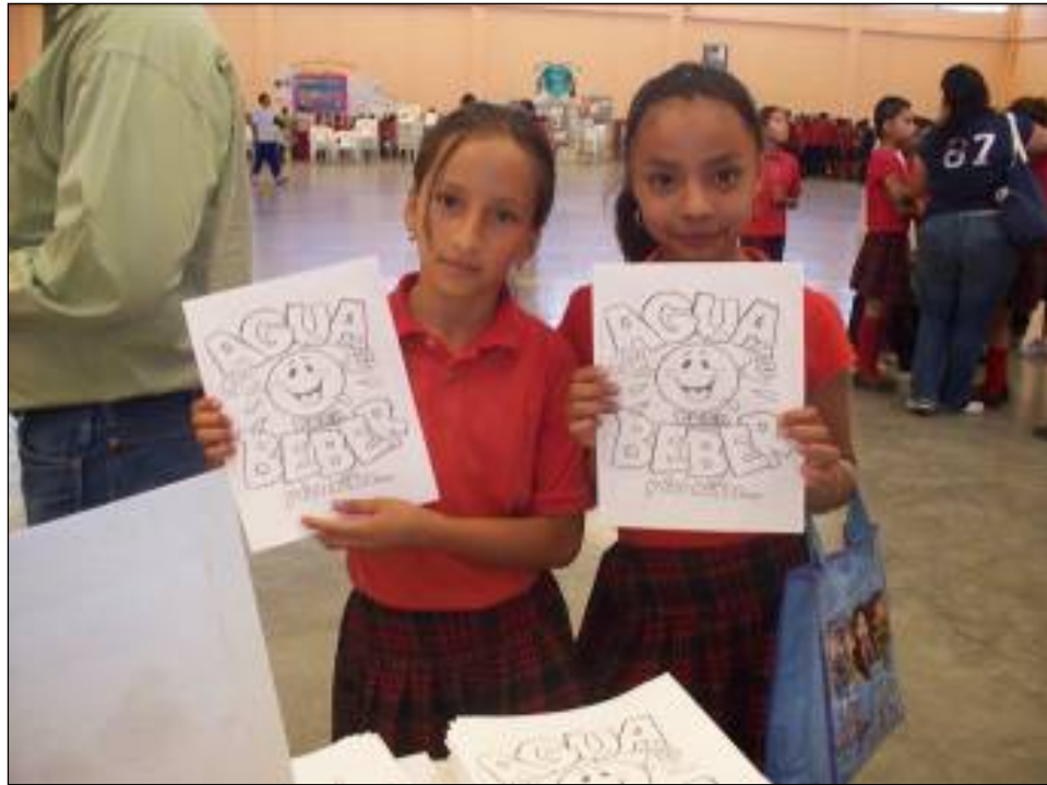
Cárteles presentados por los estudiantes