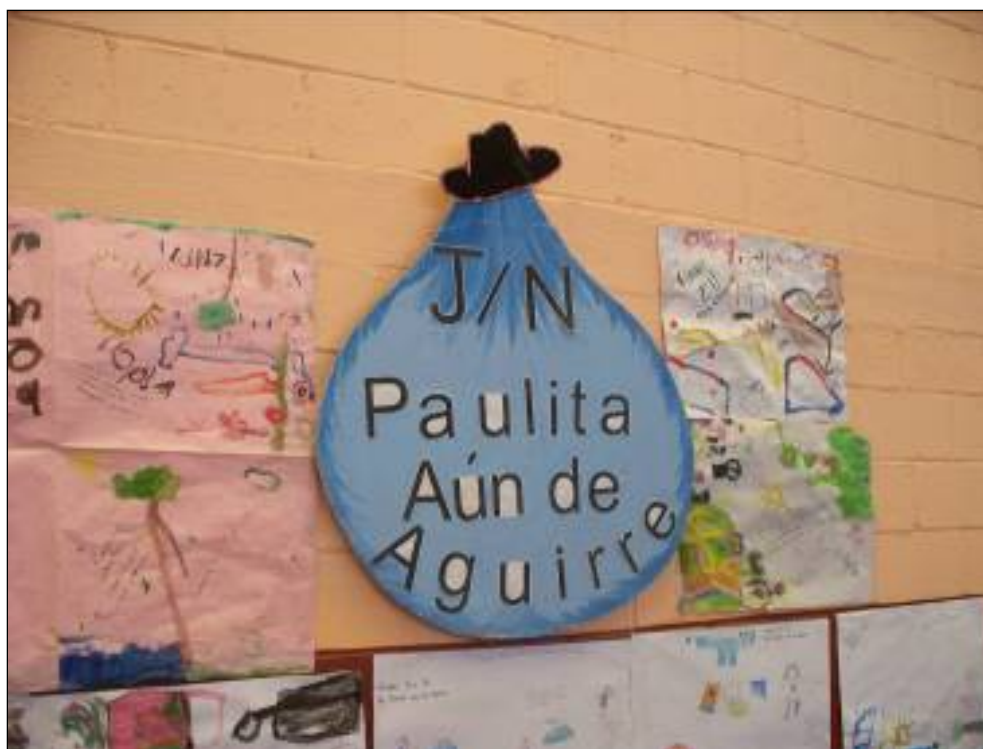
Módulos de exhibición por parte de los estudiantes