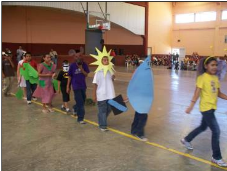
Bailables y canciones por parte de los estudiantes